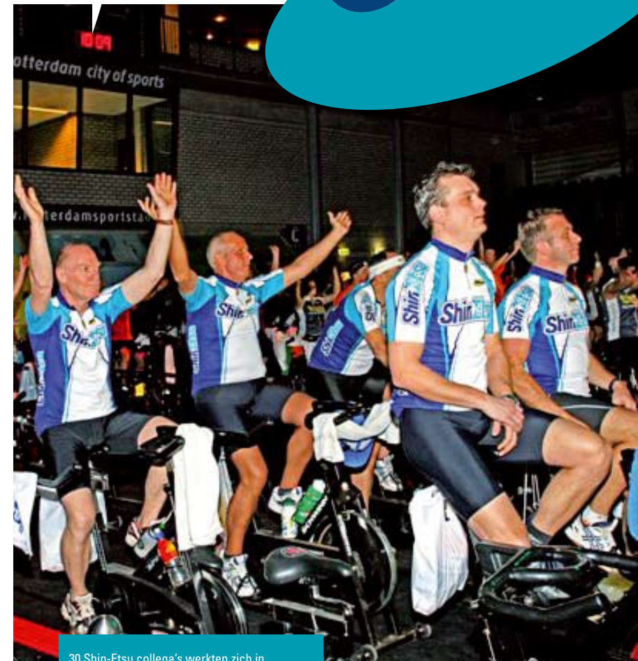
30 Shin-Etsu collega's werkten zich in het zweet voor het kinderziekenhuis

'Alle deelnemers hebben sponsorgeld opgehaald bij collega's, familie, vrienden en kennissen. Shin-Etsu heeft het geld dat bij de collega's is opgehaald verdubbeld, waardoor wij aan een totaalbedrag kwamen van € 7.910, en dat is weer 700 euro meer dan vorig jaar. Het hele evenement heeft geduurd van vrijdagavond tot en met zondagavond met een record totaalopbrengst van € 363.607. Sowieso is het prachtig om te zien dat er steeds meer Shin-Etsu-collega's bereid zijn mee te doen, en het ook nog eens erg leuk vinden. Een paar jaar geleden gingen we met z'n tweeën, dat groeide al snel naar 13, vorig jaar waren het er 27 en nu dus nog drie meer. Alle deelnemers waren heel enthousiast en volgend jaar zullen we zeker weer present zijn.'